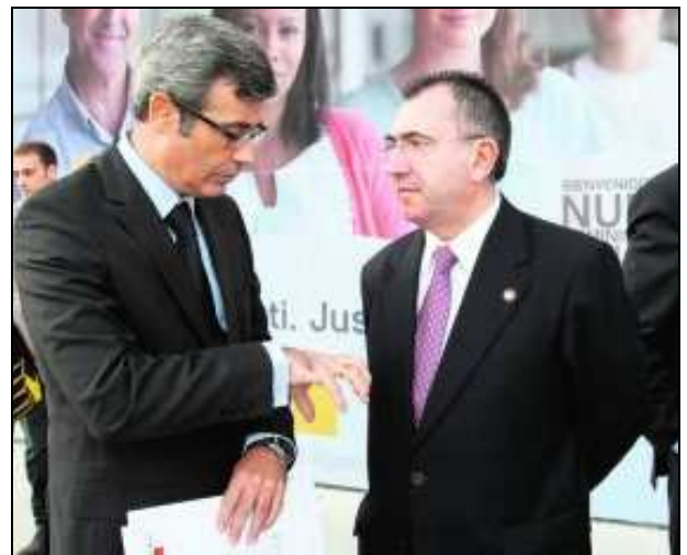
El presidente del TSJ, y el Consejero conversando frente al nuevo Palacio de Justicia

«No estoy de acuerdo en que la Oficina Judicial no pueda tener marcha atrás», sostiene